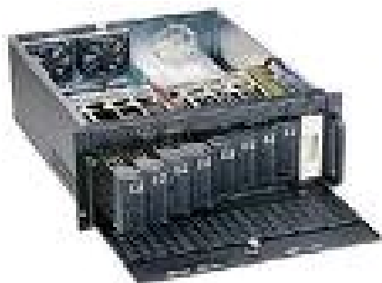
Illustration 1: Накопитель HDD GHR-422-25